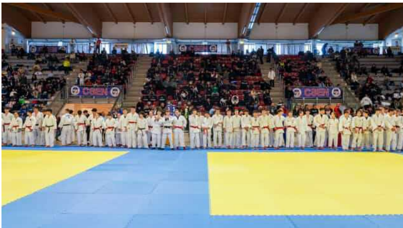
Immagine di repertorio

D ai giovanissimi ai master, tutti nella tipica divisa "judogi" stretta in vita dalle cinture dai diversi colori, fino all'ambita cintura nera. Sono gli atleti che, insieme a tecnici e giudici di gara, arriveranno a Riccione nel weekend per il 39esimo campionato italiano di judo firmato da Csen - Centro sportivo educativo nazionale.